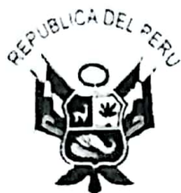
OA - 228447 Oscar Manuel ARRIOLA DELGADO TENIENTE GENERAL PNP JEFE DEL ESTADO MAYOR GENERAL DE LA POLICIA NACIONAL DEL PERÚ