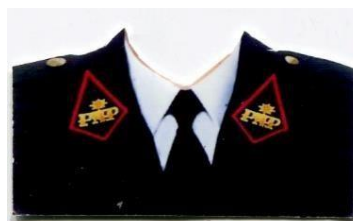
OFICIAL Y SUB OFICIAL DE SERVICIOS (MARRUECOS ROJOS)