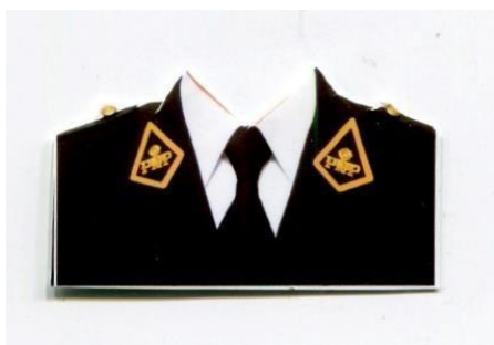
OFICIAL Y SUB OFICIAL DE ARMAS (MARRUECOS AMARILLOS)